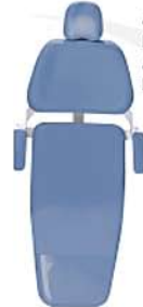
Azul Claro Blue Azul Celeste Ref. 2A