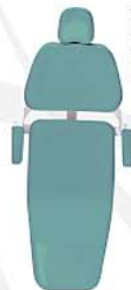
Verde Claro Green Verde Ref. 5V