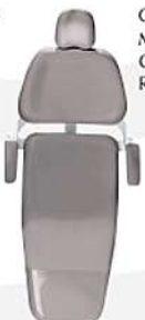
Cinza Prata Metalic Grey Gris Metalizado Ref. 1CP