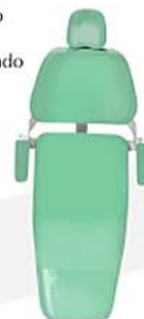
Verde Metálico Metalic Green Verde Metalizado Ref. 13VM