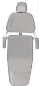
Cinza Grey Gris Ref. 7C