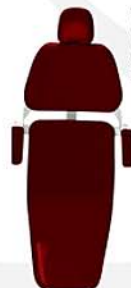
Vermelho Rose Vintage Graná Ref. 10V