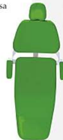
Verde Brasil Green Brazil Verde Brasil Ref. 12V