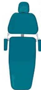
Verde Turquesa Mint Green Verde Menta Ref. 6V