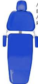
Azul Safira Blue Safira Azul Safira Ref. 15A