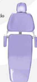
Azul Metálico Metalic Blue Azul Metalizado Ref. 2AM