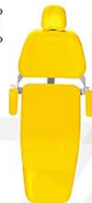
Amarelo Dourado Gold Amarillo Dorado Ref. 18A