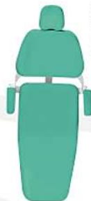
Verde Cítrico Green Citric Verde Cítrico Ref. 11V