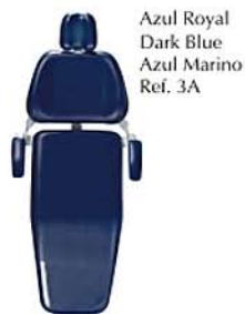
Azul Royal Dark Blue Azul Marino Ref. 3A