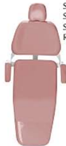
Salmão Salmon Salmón Ref. 8S