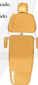
Laranja Orange Naranja Ref. 4L