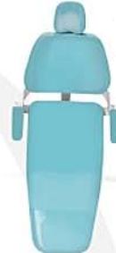
Azul Cristal Blue Cristal Azul Cristal Ref. 16A